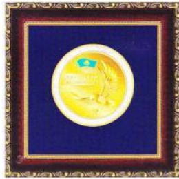
Медаль «ЛИДЕР КАЗАХСТАНА 2013»