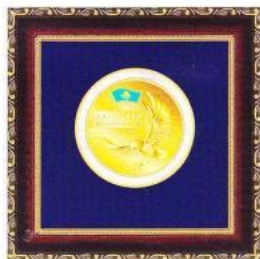
Медаль «ЛИДЕР КАЗАХСТАНА 2013»