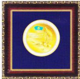
Медаль «ЛИДЕР КАЗАХСТАНА 2013»