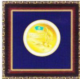
Медаль «ЛИДЕР КАЗАХСТАНА 2013»